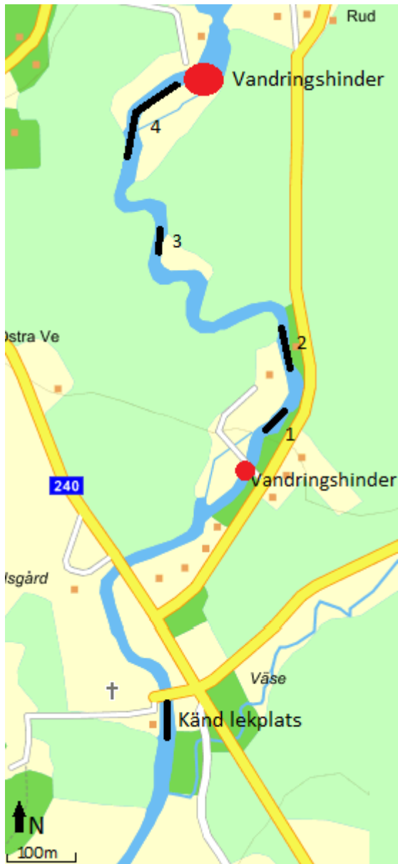
Figur 2. Positionen för lekplatsen vid Väse kyrka samt positionerna för vandringshinder och de fyra potentiella lekplatserna (1-4) mellan vandringshindren.

Ingen asplek observerades uppströms lekplatsen där lek noterades på de nedre till mittre delarna av sträckan. Ett tiotal romkorn hittades precis nedströms det första vandringshindret och ännu färre på lekplats 2 och 3 uppströms vandringshindret (Fig. 2). Rommen har lämnats in till Länsstyrelsen i Värmland för DNA-analys.