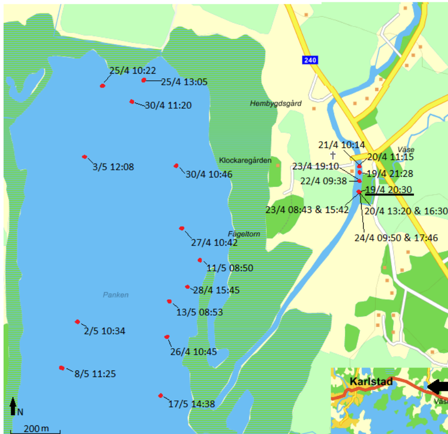
Figur 4. Positioner som asp 392 befunnit sig på vid pejling. Understruken tid markerar starttiden för studien av 392. Infälld bild visar Pankens lokalisering (svart pil).

Den tredje aspen (benämns härefter 502) sattes ut uppströms vandringshindret den 19/4 kl 20:41 (Fig. 5) och kl 23:02 passerade den vandringshindret och begav sig nedströms. Inga försök att åter passera vandringshindret gjordes. Den 20/4 kl 11:15 befann den sig strax nedströms lekplatsen. I detta område stannade den i tre dagar och den 23/4 kl 13:38 pejlades den in där sista gången. Senare samma dag kl 17:06 lokaliserades den i Pankens mitre västra delar. Vid studiens slut den 23/5 lokaliserades 502 kl 14:43 i den nordöstra delen av Panken.