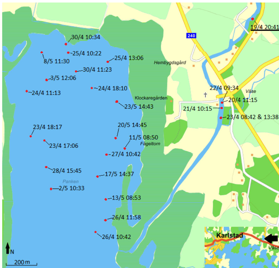
Figur 5. Positioner som asp 502 befunnit sig på vid pejling. Understruken tid markerar starttiden för studien av 502. Infälld bild visar Pankens lokalisering (svart pil).