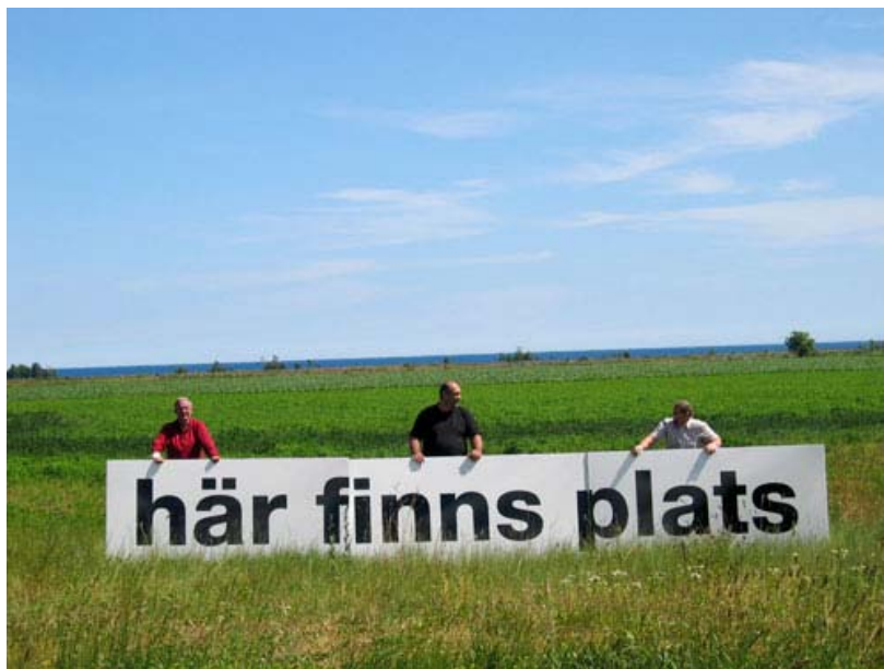
Montagearbete av konstverket i Stenåsa.

projektledningen i samråd med konstnären beslutade att ta bort det, eller rättare sagt det som var kvar.