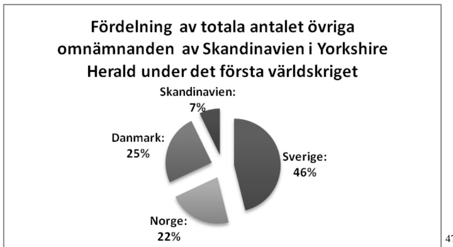
Diagram som visar de sammanlagda så kallade ”övriga” omnämningarna av Skandinavien i Yorkshire Herald under hela undersökningsperioden fördelat i procent.

Baserat på omnämningar i Yorkshire Herald mellan 1/9 -1914 – 11/11 -1918