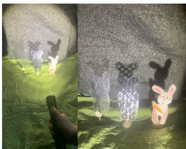
Figur 3: Barnen utforskade att olika material gör olika skuggor

Barnen i grupp 2 var nyfikna och visade intresse. Lisa ville veta vad som skulle hända när kaninen skuttar ännu närmare ljuskällan och provade det i praktiken. För att barnen inte skulle tappa intresset för aktiviteten behövde de ges nya utmaningar. Barnen fick möjlighet att utforska det fysikaliska fenomenet ljus och skugga från olika perspektiv. Grupp 1 testade att belysa en genomskinlig och icke-genomskinlig kanin samtidigt medan grupp 2 också belyste en halv-genomskinlig kanin. Här användes variationsmönster kontrast och generalisering . Alla objekt var en kanin men de var gjorda av olika material (se figur 3). Materialet varierade men objektets form var invariant för att tydliggöra skillnaderna mellan lärandeobjektet. Här fokuserades på skuggan och dess styrka. Det blev synligt att det finns en kontrast mellan alla kaninernas skugga. Den ena kaninen är ljusare än de andra. Syftet med den delen var att barnen skulle upptäcka att olika material släpper igenom olika mycket ljus och att skuggan är det område dit ljus inte kan komma.