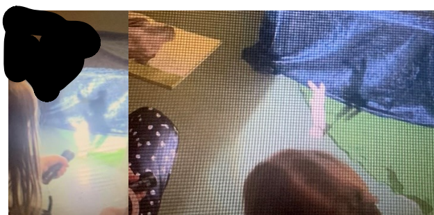
Figur 1: Barnen utforskar skuggans längd

Lasse i grupp 1 var först med att hålla i ficklampan och uppmanades av mig att rikta ljuset åt olika håll. Genast började han undersöka hur skuggan förändras när avståndet mellan ljuskällan och kaninen ändrades (se figur 1). Efter att han förflyttat sig baklänges gick han närmare kaninen med ficklampan och jag uppmärksammade barnen på att skuggan då blir större. Omedelbart konstaterade Frida att ”går man längre bort då blir den mindre och mindre”. I grupp 2 fick Lisa börja hålla i ficklampan. Jag undrar hur man får en stor skugga av kaninen som i boken och visar barnen respektive sida. Barnen visar engagemang och samarbetar.